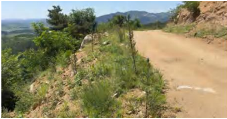
检修道路区域生态恢复