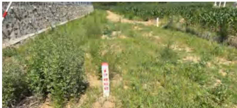
地埋线路区域生态恢复