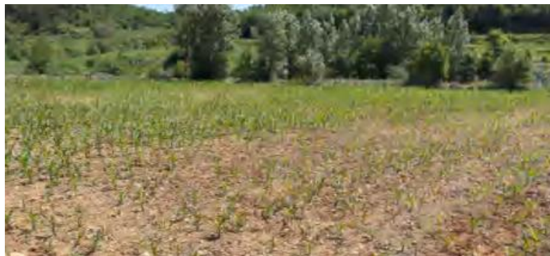
施工生产、生活区域生态恢复