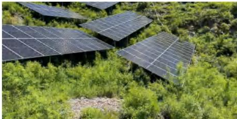
光伏区域生态恢复

运营期：光伏电场区原地貌主要是以杂草及低矮灌木为主。施工结束后及时进行场地平整，植被恢复，降低对原有生物量的影响，在附近种植草本，恢复生态。对临时场地进行恢复，拆除临时建筑物，掘除硬化地面，弃渣运至规定地点掩埋。同时结束后对场区适宜绿化的地方进行绿化，实施植被恢复措施。集电线路（包括穿越生态红线部分）施工便道的恢复较好，现场已看不到施工时留下的痕迹，均已恢复为周围地表植被。经调查，升压站区域周围植被恢复较好，已恢复到自然生态状态。集电线路塔基周围植被恢复措施已经实施，已恢复到自然生态状态。光伏场内在光伏板底和光伏板之间进行植被恢复；检修道路两侧播撒草籽、种植树木。共播撒苜蓿草、狗尾草、爬山虎约草籽 1500 公斤，种植油松、云杉树 6000 株。