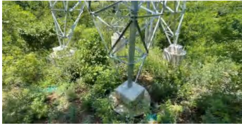
架空线路区域生态恢复